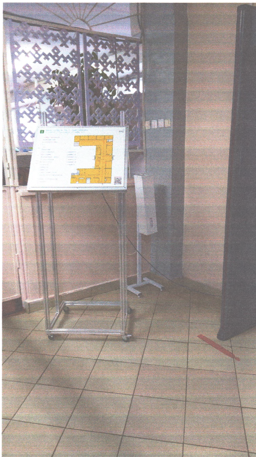
Фото №2. Мнемосхема на 1-ом этаже.