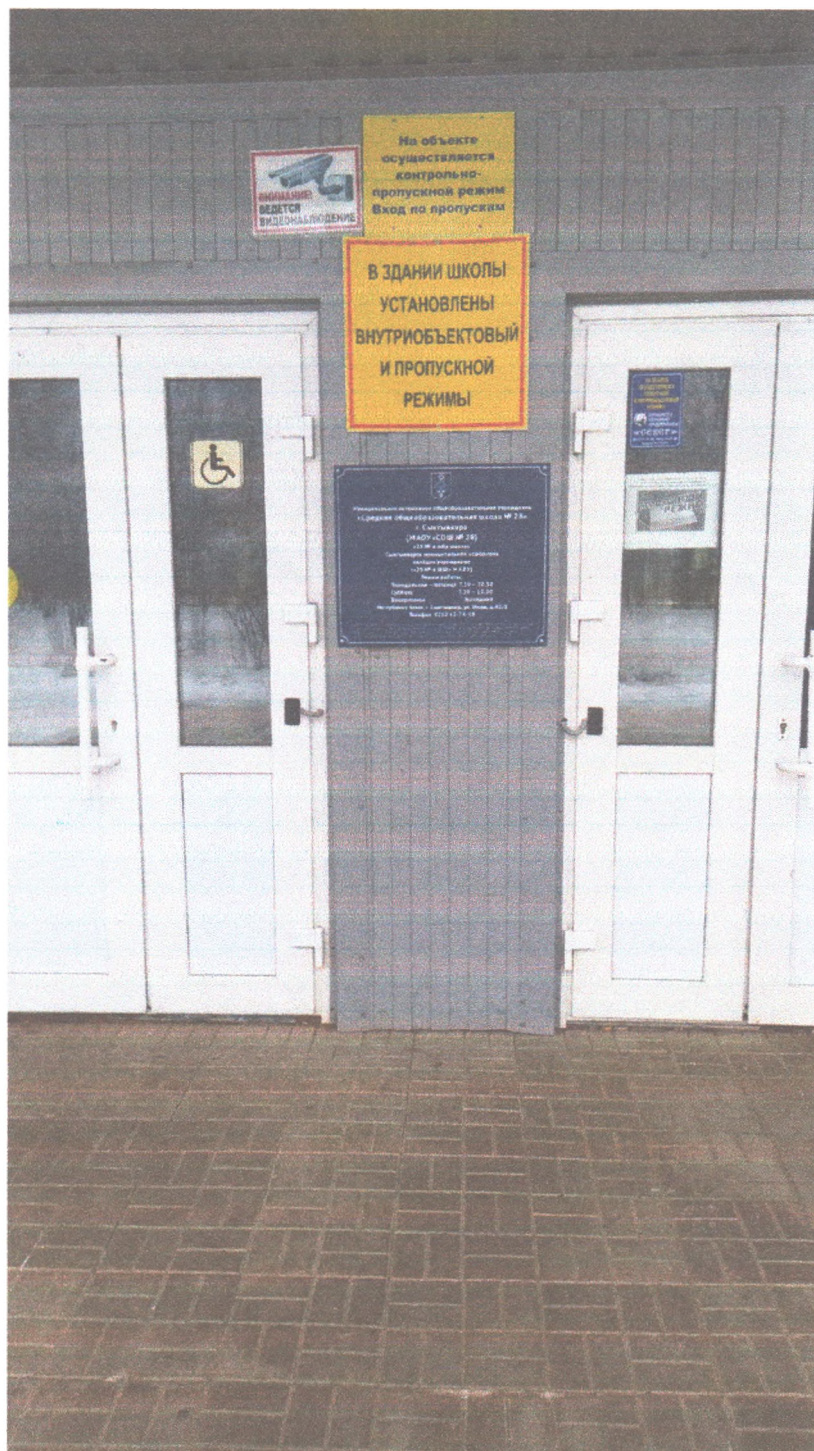
Фото №1. Табличка на входе в здание школы выполненная шрифтом Брайля.